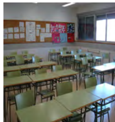
FOTO: Orden en el aula