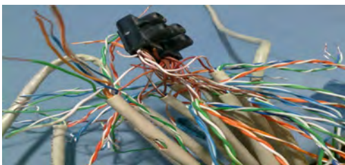
FOTO: Cables desnudos