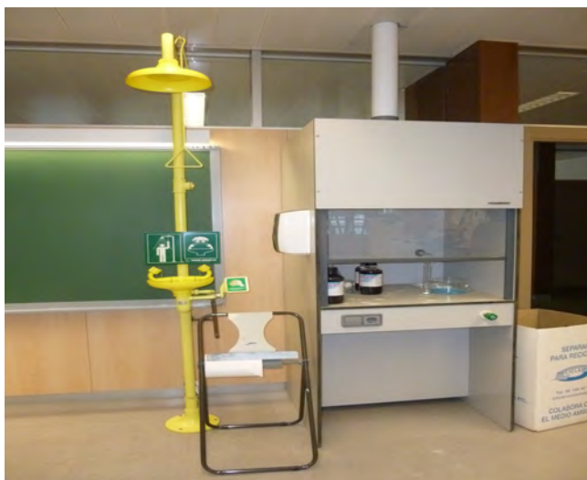
Foto: Vitrina de centro educativo