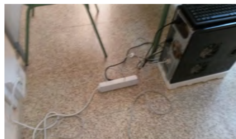
FOTO: Conexiones intermedias. Cableado zona de paso.