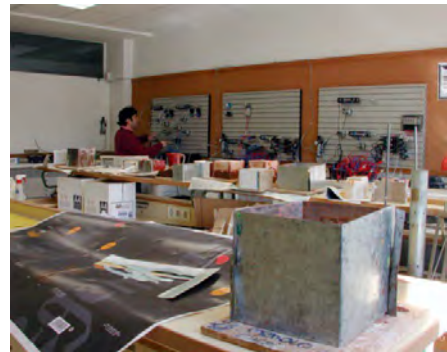
FOTO: Objetos bien almacenados