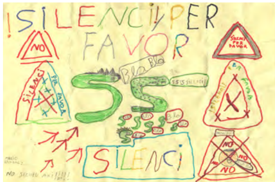
Foto: cartel infantil