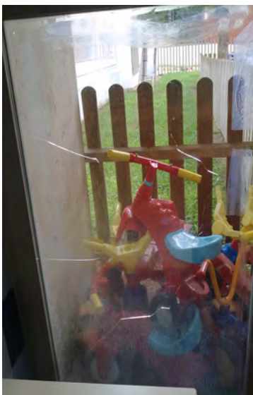
FOTO: Puerta transparente sin señalización y objetos mal almacenados