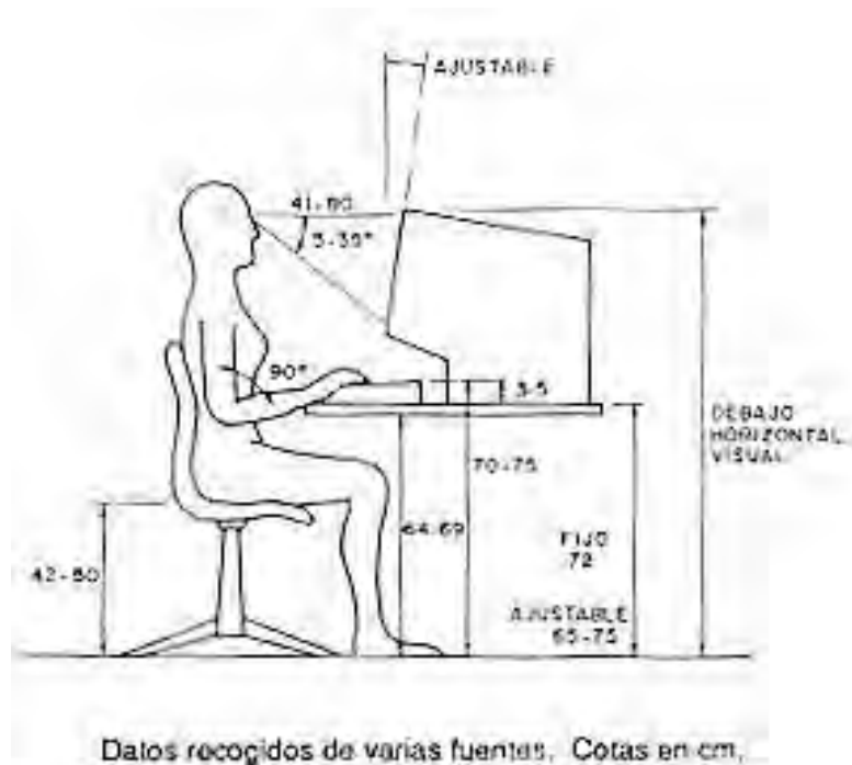
NTP: 232. Pantallas de visualización de datos (PVD).